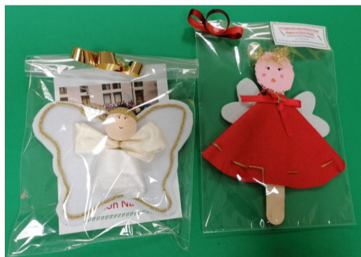
Il regalo presentato quest'anno al reparto di pediatria dell'ospedale di San Bonifacio

Ripensando a questa emozionante occasione, vogliamo condividere con tutti un'intensa poesia di Madre Teresa di Calcutta dedicata al senso della vita. Lei si definiva "una piccola matita nelle mani di Dio" e queste sue parole rappresentano molto bene i valori cristiani che hanno accompagnato la sua vita al servizio delle persone più fragili e bisognose di affetto.